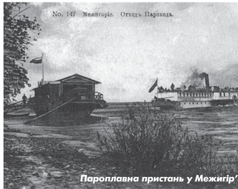
Пароплавна пристань у Межигір'ї

Святість та багата історична пам'ять цього місця разом з чудовою природою та мальовничими краєвидами сприяла численним відвідуванням. Чимало киян користувалися тут дачними приміщеннями, що їх надавав у оренду монастир. Для зручності сполучення у Межигір'ї діяла пароплавна пристань.