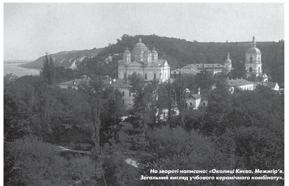
На звороті написано: «Околиці Києва. Межигір'я. Загальний вигляд учбового керамічного комбінату».