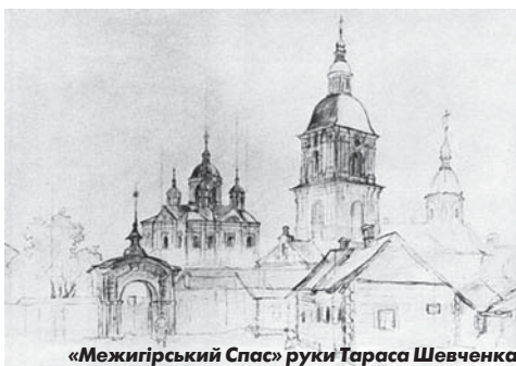
«Межигірський Спас» руки Тараса Шевченка

У ці часи сюди навідувався Тарас Шевченко, котрий згадавав «Межигірський Спас» у своїх творах. Залишився його малюнок олівцем 1843 року.