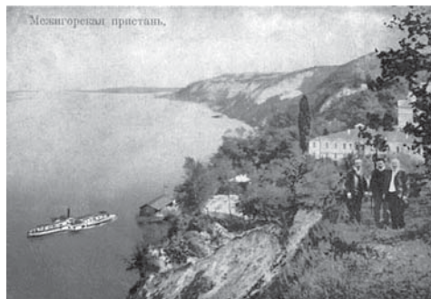
А на цій поштівці бачимо (праворуч) трійку заможних панів, які, мабуть, нещодавно прибули сюди на відпочинок. Вони позують на тлі межигірських будівель – але ж добре розуміють, що вони тут не хазяї, а лише гості.