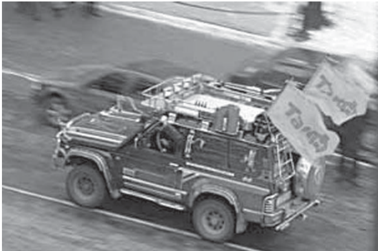
(Закінчення. Поч. на 1 с.)

почали правити "бояри", які почали шматувати владу, маючи за головне завдання посадити усяди, на усі місця якомога більше "своїх" людей.