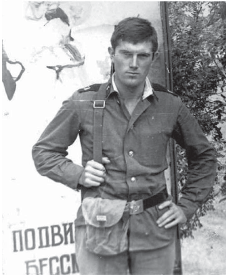
На фото: Виктор Ющенко на службе в погранвойсках Советской Армии Примерно в это же время Виктор Янукович отбывает второй срок в тюрьме