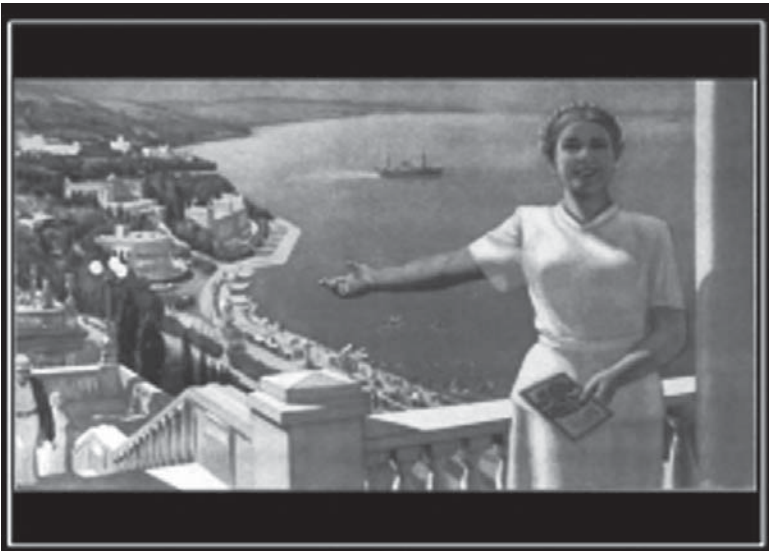
Вложил деньги в ПИФы верные - будешь в Сочи отдыхать (наверное)