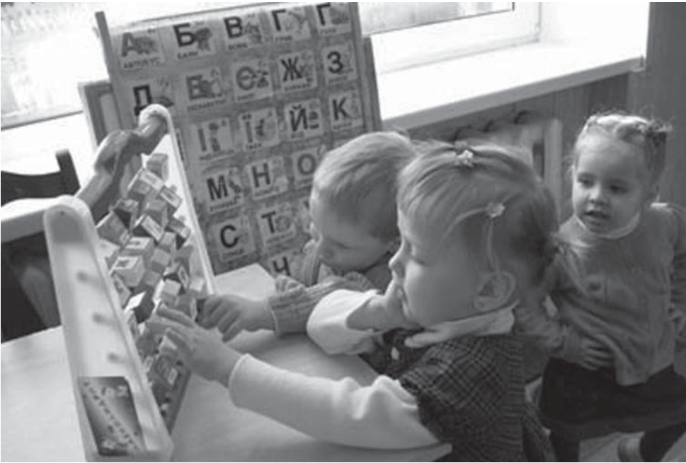
Мовна послідовність освітан

Законопроект Табачника - Азарова про те, що мову спілкування в дитсадках мають обирати батьки дошкільнят, - не лише гуманітарне відкочування назад. Це абсолютно недалекоглядна і, зрештою, програшна ініціатива, що має на меті відвернути увагу розбурханого суспільства від справді важливих проблем освіти.