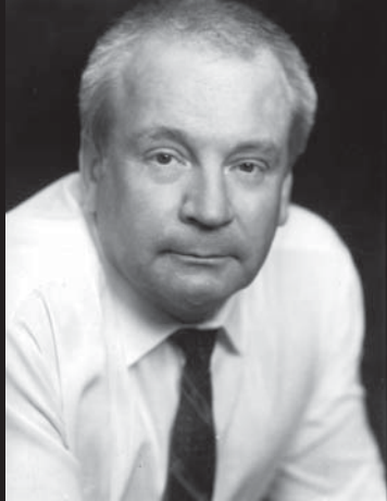
Закінчення. Поч. в №49 (301)