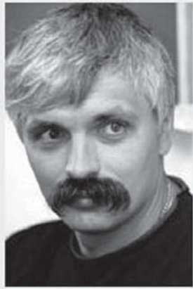
Дмитро Корчинський, лідер партії "Братство":