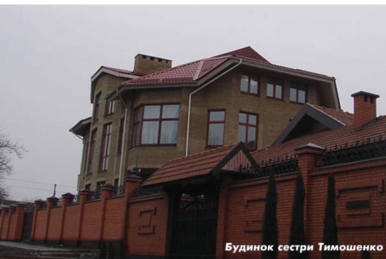
Будинок сестри Тимошенко

Попри кризу, Юлія Тимошенко та її родина продовжують обростати нерухомістю. У Дніпропетровську в них з'явилася ще одна триповерхова "хатинка".