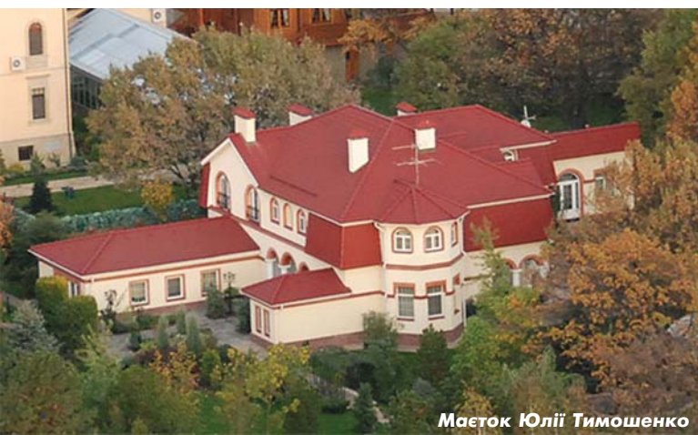
Маєток Юлії Тимошенко