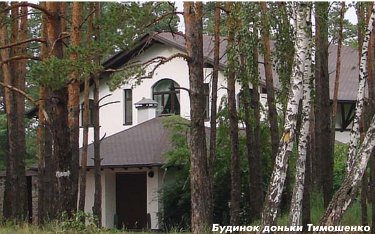
Будинок доньки Тимошенко