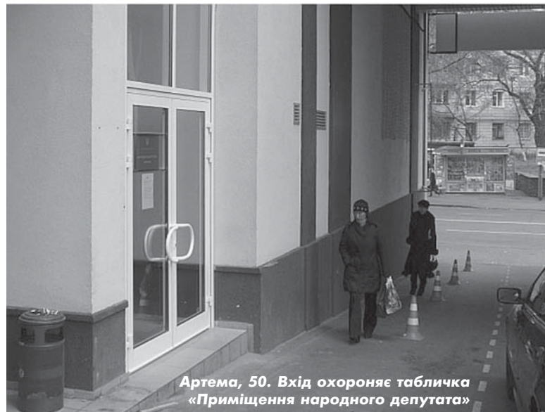
Артема, 50. Вхід охороняє табличка «Приміщення народного депутата»