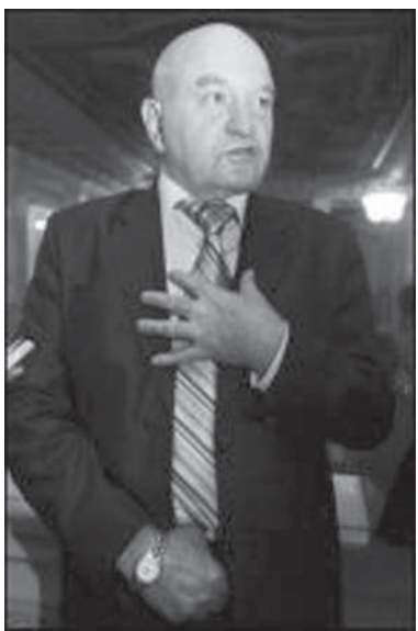
(Закінчення. Поч. на 2 с.)

Янукович призупинив членство в партії на період виборів. У цей час один із його заступників готував би партію до місцевих виборів. Бо вибори президента і в місцеві ради - абсолютно різні. На президентських виборах у другому турі комуністи і ряд інших сил голосуватимуть за Януковича. Але на